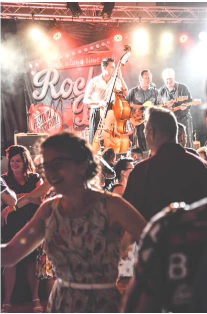
Festival Rock in Berry 2019