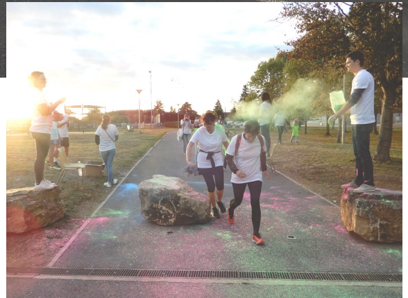
Le couleurs run 2019