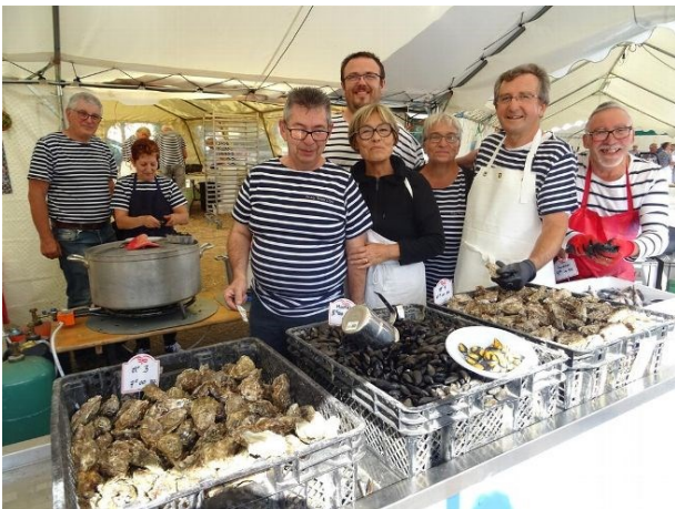
Fête des flots 2019