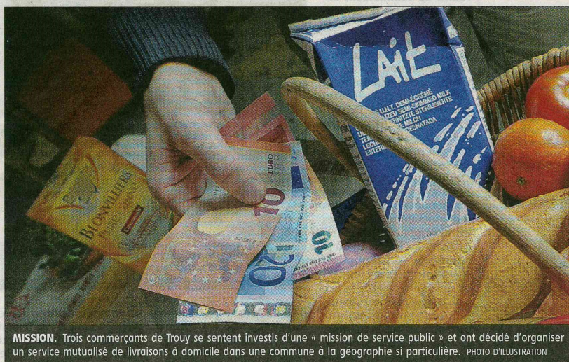
MISSION. Trois commerçants de Trouy se sentent investis d'une « mission de service public » et ont décidé d'organiser un service mutualisé de livraisons à domicile dans une commune à la géographie si particulière. PHOTO D'ILLUSTRATION

Besoin d'une baguette façonnée par le boulanger ? D'un plat mitonné par le charcutier-traiteur ? De boîtes de conserve rangées dans les rayons de l'épicier ? Un coup de fil plus tard, l'un des commerçants rassemble la commande et débarque