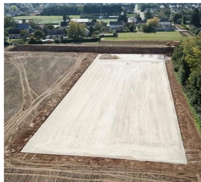
Vue aérienne du site du boulodrome de Troy en construction

Cette solution a été récompensée par le Prix innovation de la sécurité routière 2019.