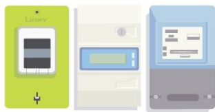
Sa taille est identique à celle de votre compteur actuel. Ni le compteur Linky, ni sa pose ne vous seront facturés.